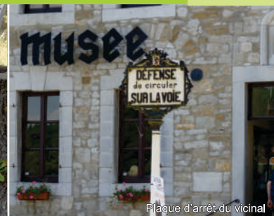
Plaque d'arrêt du vicinal