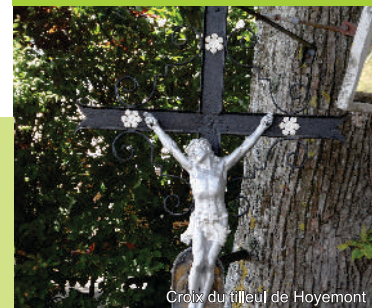
Croix du tilleul de Hoyemont

Avec le soutien du Commissariat Général au Tourisme de la Région Wallonie et de la Maison du Tourisme du Pays d'Ourthe-Ambève. Ed. resp.: Royal syndicat d'initiative de Comblain-au-Pont et Poulseur, Graphisme: GREOA.