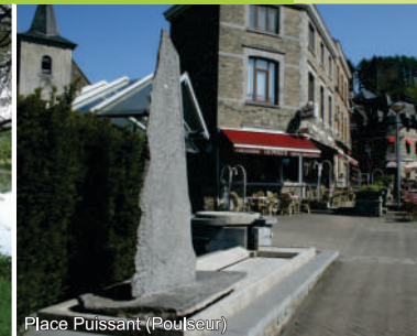
Place Puissant (Poulseur)