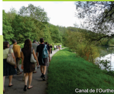
Canal de l'Ourthe

Avec le soutien du Commissariat Général au Tourisme de la Région Wallonie et de la Maison du Tourisme du Pays d'Ourthe-Ambève, Ed. resp.: Royal syndicat d'Initiative de Comblain-au-Pont et Poulseur, Graphisme: GREOA.