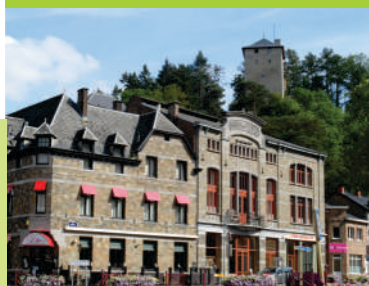
Maison du Peuple (Poulseur)